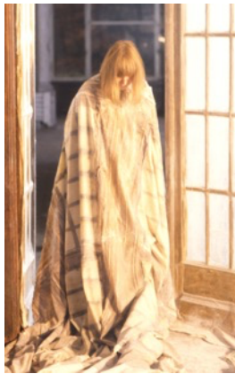
Heidi Bucher in Latexhaut des Kleinen Glasportals, 1988