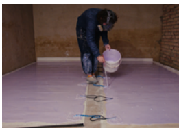
Liesl Raff beim Giessen einer Latexarbeit im Studio