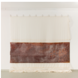
Liesl Raff Wallpiece (Heidi 1) , 2026