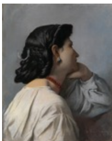
Anselm Feuerbach, 1829–1880 Iphigenie , 1870 Öl auf Leinwand, 62.5 x 49.5 cm Kunst Museum Winterthur, Stiftung Oskar Reinhart