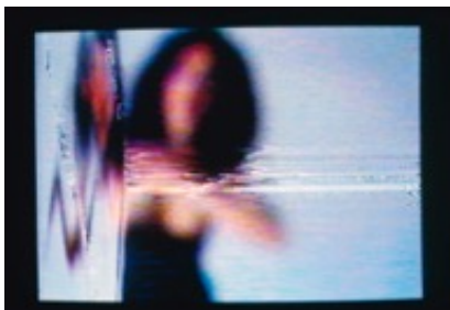
I'm Not The Girl Who Misses Much <Ich bin nicht das Mädchen, das viel vermisst>, 1986, video by Pipilotti Rist (video still)