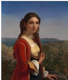
Louis-Léopold Robert, 1794–1835 Mädchen von Procida , 1822 Öl auf Leinwand, 81 x 68.5 cm Kunst Museum Winterthur, Stiftung Oskar Reinhart