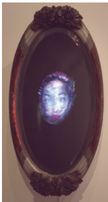
Olga Titus (*1977) Mirror Mirror on the Wall , 2010 (Nr. 3 von 5 | A.P. II) Video Installation Holzrahmen mit Spiegel, Acrylmalerei 74 x 38 x 17 cm