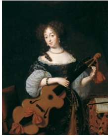
Michiel van Musscher, 1645–1705 Bildnis einer jungen Dame mit Viola da Gamba , 1677 Öl auf Leinwand, 36 x 29 cm Kunst Museum Winterthur, Stiftung Jakob Briner