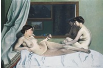
Félix Vallotton, 1865–1925 Le repos des modèles , 1905 Öl auf Leinwand, 130 x 195.5 cm Kunst Museum Winterthur