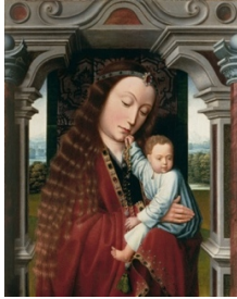
Meister vom Heiligen Blut Maria mit Kind in architektonischer Rahmung , um 1520 Öl auf Holz, 44,4 x 35,5 cm Privatbesitz