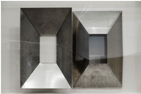
Thea Djordjadze *1971 Space under, 2016 (Detail) Plexiglass, metal, paint, wood 210,2 x 840,8 x 47 cm © 2019, ProLitteris, Zurich On view in Projects 103: Thea Djordjadze at MoMA PS1, New York April 3-August 28, 2016.