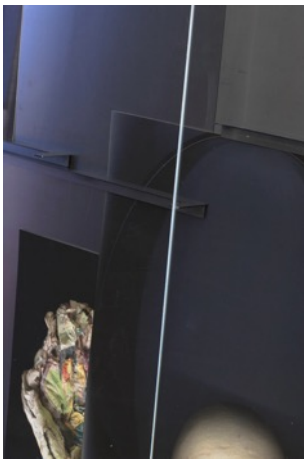
Thea Djordjadze *1971 Untitled, 2019 (Detail) Steel, acrylic glass, print on nickel silver, print on Hahnemühle paper 283,5 x 587,6 x 39 cm © 2019, ProLitteris, Zurich