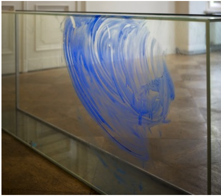
Thea Djordjadze *1971 Untitled, 2019 Glass, paint 75 x 180 x 26cm © 2019, ProLitteris, Zurich